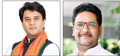
ज्योतिरादित्य सिंधिया राव यादवेंद्र सिंह

प्रदेश की गुना-शिवपुरी लोकसभा सीट में कांग्रेस ने भाजपा के ज्योतिरादित्य सिंधिया को उनकी ही शैली में जवाब देने की कोशिश की है। 2019 के चुनाव में वे कांग्रेस से भाजपा में गए और अपने ही सहयोगी केपी सिंह यादव से चुनाव हार गए थे। इस बार सिंधिया भाजपा में हैं और पार्टी ने केपी का टिकट काटकर उन्हें ही टिकट दे दिया है। कांग्रेस ने भी नहले पर दहला जड़ते हुए क्षेत्र में भाजपा के कद्दावर नेता रहे देशराज सिंह यादव के बेटे राव यादवेंद्र सिंह को मैदान में उतार दिया है। क्षेत्र में यादव मतदाताओं की तादाद ज्यादा है। केपी सिंह यादव का टिकट काटे जाने के